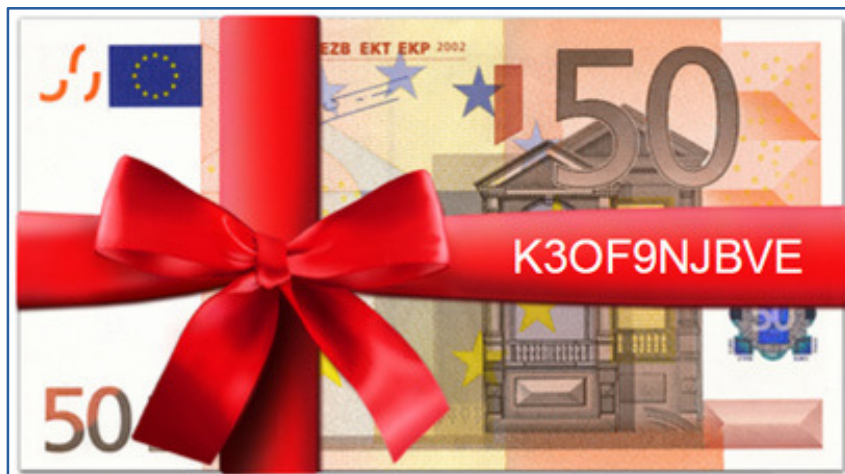
Abbildung 8: Geschenk-Design mit eingedrucktem Geschenkcode

Der erzeugte Geschenk sieht dann beispielsweise so aus: