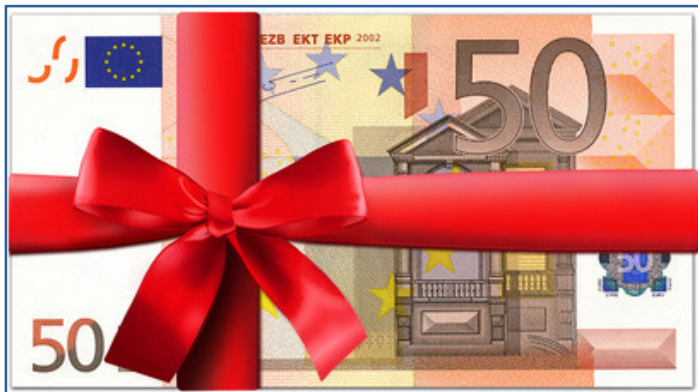
Abbildung 4: Beispiel für ein Gutschein-Design (PDF)

Der Gutscheincode soll rechts auf die rote Schleife gedruckt werden. Geben Sie zunächst in die Felder Gutscheincode x-Position und Gutscheincode y-Position jeweils den Wert 20 ein. Wählen Sie eine Schriftart Ihrer Wahl und setzen Sie die Schriftgröße beispielsweise auf 24 . In unserem Fall soll die Schriftfarbe weiß sein, sodass wir den Farbcode FFFFFF in das Feld Gutscheincode Schriftfarbe eintragen. Unterstützung zur Auswahl des Farbcodes erhalten Sie hier: http://html-color-codes.info/webfarben_hexcodes/